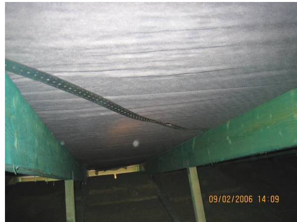
Obr. 5 - Chýbajúci segment vystužovadla a neúčinné (uvoľnené) vystuženie ocelovým pásom