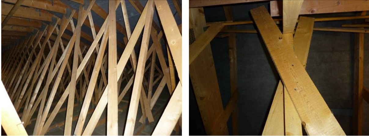
Obr. 8 - Štíhle (neúčinné) prúty pozdĺžneho vystužovadla a nedostatočný prípoj

väzníka). Pri diagnostických prehliadkach boli na strešných konštrukciách v prevažnej miere použité prúty s veľmi vysokou štíhlosťou (nad 200), ktoré nie je možné započítať ako nosné prvky, a ani rozmiestnenie a počet spojovacích prostriedkov (klince) nezodpovedali požiadavkám pre nosné prípoje. Pásovité prúty boli použité iba ojedinele.