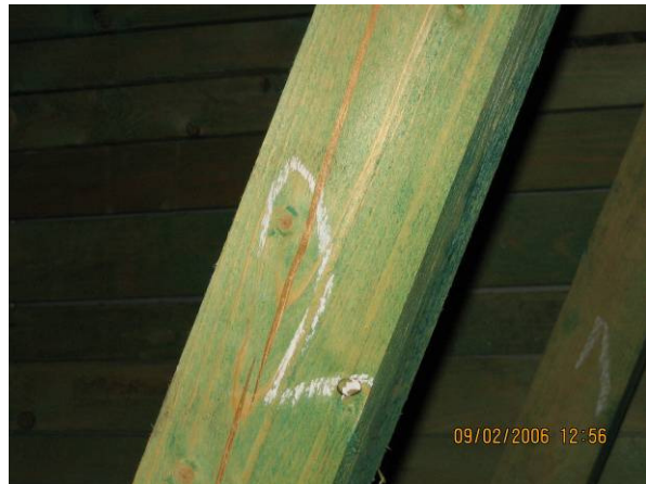
Obr. 3 - Neodborné zásahy do nosnej konštrukcie a vady materiálu

Takéto riešenie však predpokladá, že priehradový väzník bude výlučne namáhaný iba zaťažieniami pôsobiacimi v jeho strednicovej rovine (zvislé zaťaženia) a stabilita tlačných prútov z roviny väzníka bude zabezpečená vhodne navrhnutým systémom vystužovadiel. V prípade, že nie sú dodržané spomínané skutočnosti, dochádza ku niekoľkonásobnému (nekontrolovanému) nárastu namáhania niektorých častí väzníka (tlačené prúty, styčníky s oceľovými doskami, ohyb prútov z roviny väzníka), ktoré môže viesť ku porušeniu jednotlivých nosných prvkov alebo až ku kolapsu celej strešnej konštrukcie.