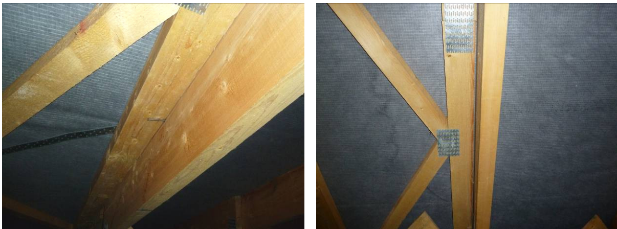
Obr. 7 - Nedostatočné pripojenie vystužovadla k pásoch priehradového väzníka