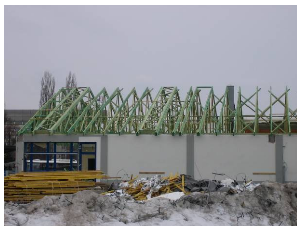
Obr. 1 - Montáž strešnej konštrukcie z drevených väzníkov