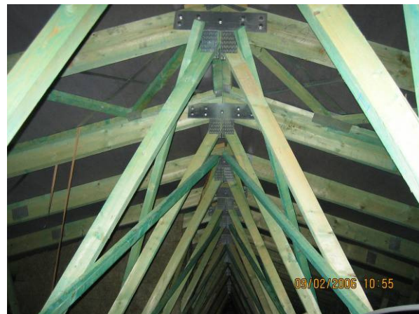
Obr. 2 - Priehradový väzník so styčnicami s ocelovými doskami s prelisovanými trňmi