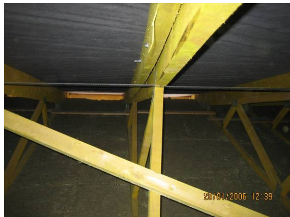
Obr. 4 - Nedostatočne stabilizovaný (vybočený) tlačný pás väzníka

Ani v jednom prípade, kedy bol kontrolovaný predložený statický výpočet, nebola funkcia ani reálne zaťaženie vystužovadiel overované podrobnejším statickým výpočtom (zaťaženie vetrom, zaťaženie od stabilizácie tlačných častí väzníka). Žiadnym spôsobom takisto nebola overovaná ani interakcia vystužovadiel a priehradových väzníkov, nehovoriac o navrhovaní detailov prípojev vystužovadiel ku pásom väzníka a pod. Strešný väzník bol posudzovaný ako samostatná rovinná konštrukcia, zaťažená výhradne zvislými účinkami (vlastná tiaž, krytina, podhľad a sneh). Výstužný systém bol vo väčšine prípadov zhotovený podľa akýchsi „konštrukčných“ zásad dodávateľa strešnej konštrukcie. Takto navrhnutý a zhotovený systém vystužovadiel bol veľmi často nielenže neúplný, ale obsahoval navyše prvky, ktoré boli neúčinné, chaoticky usporiadané alebo nadbytočné.