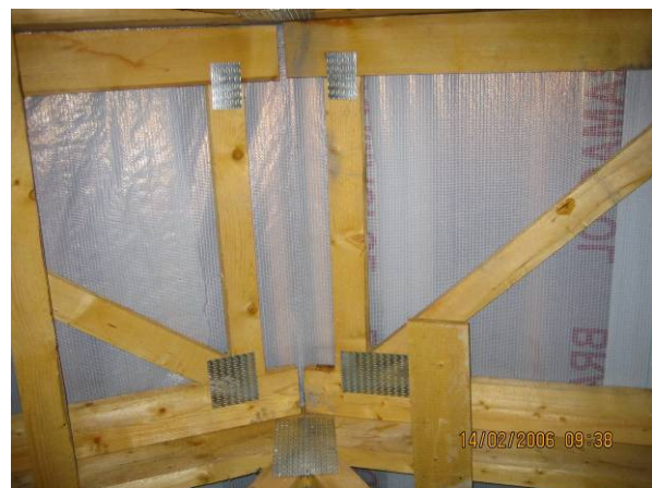
Obr. 6 - Neprepojené segmenty priečného strešného vystužovadla